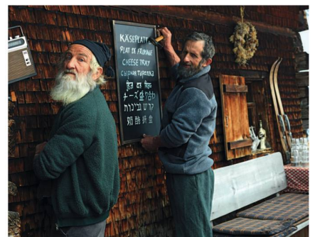
... und rocken die Alp mit Volksmusik. ... et une ambiance folklorique assurée!