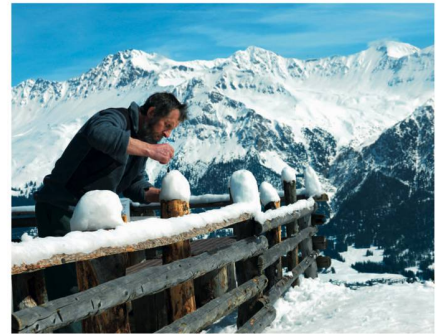
Sie sorgen liebevoll für Schneekosmetik... Une couche de neige millimétrée...

Ce sont également les arguments du spot publicitaire de ST, élément central du marketing d'hiver. Il met en scène des gardiens de refuge perfectionnistes qui donnent au cliché du chalet suisse traditionnel un brillant nouveau. Diffusé en prime time en Suisse, Allemagne, France et Italie, ce spot télé a remporté l'argent aux Epica Awards 2009, les principaux prix de la branche européenne de la publicité.