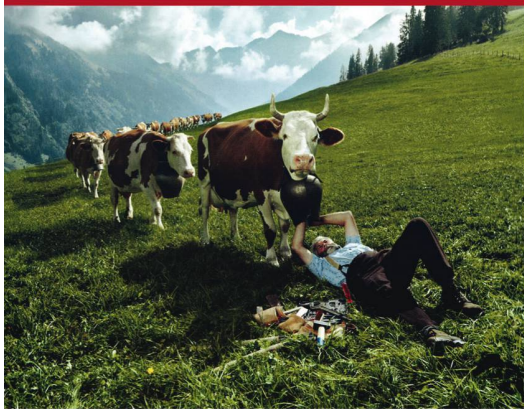
Munter: Mantelwerbung im «Stern». Publicité en couverture du magazine allemand «Stern».