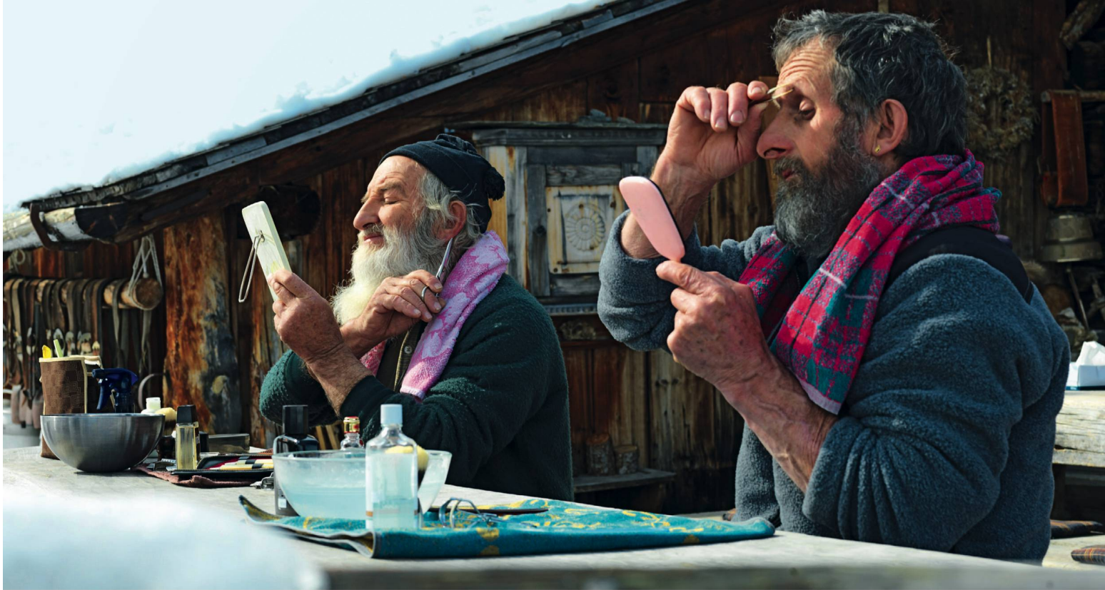
Dieser Spot gewinnt die Herzen der Zuschauer – und den «Epica Silver Award»: Die Hüttenwarte tun alles für perfekte Winterferien. Des gardiens de refuge qui font tout pour des vacances d'hiver parfaites: ce spot a gagné les suffrages des téléspectateurs (et remporté un Epica d'argent).