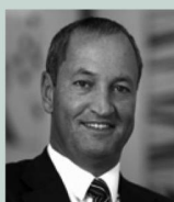
Guglielmo L. Brentel

Präsident Ticino Turismo, Präsident Internationales Film Festival Locarno