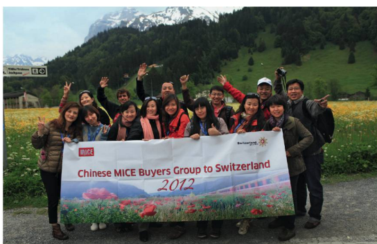
Die Teilnehmenden der Studienreise aus China bei ihrem Ausflug auf den Titlis.

Die ST-Abteilung SCIB baute die Marktpräsenz 2012 in den Städten Peking, Schanghai, Hongkong und Guangzhou aus. Dazu gehörten unter anderem Schulungen mit Incentive-Agenturen und anderen wichtigen Entscheidungsträgern. SCIB koordinierte hierzu eine Studienreise für zwölf Organisatoren von Incentive-Reisen nach Zürich, Luzern und auf den Titlis, aus der bereits erste Folgegeschäfte entstanden.