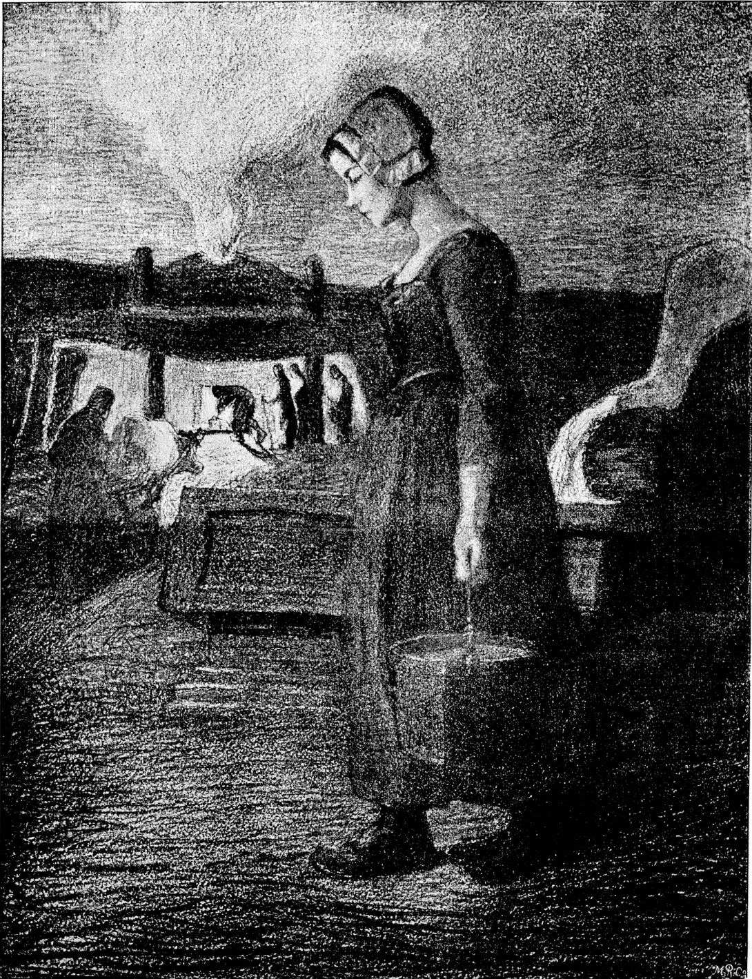
Kohlenzeichnung von Giovanni Segantini. — Dessin au fusain de Giovanni Segantini .

Il était « embauché » chez un peintre dont la profession consistait à peindre dans la journée des décors de théâtre et de jouer le soir le « minigino » (une sorte