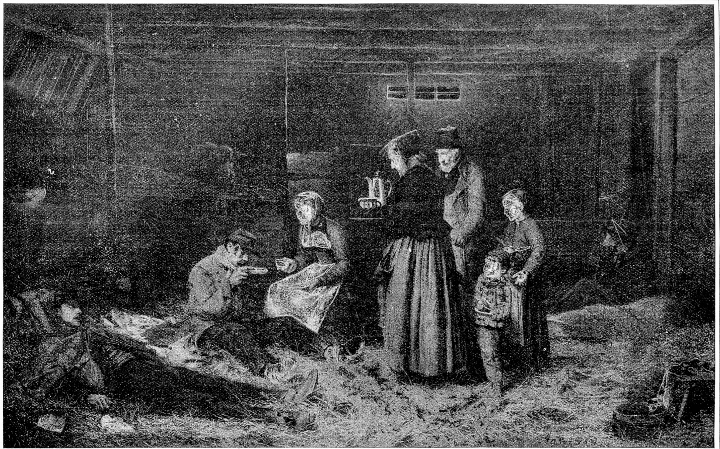
Schweizerische Gastfreundschaft, nach einem Gemälde von Albert Anker.