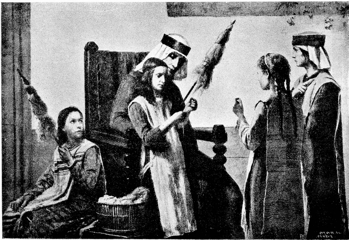
Die Königin Berta, nach einem Gemälde von Albert Anker.

Bis in seine letzten Lebenstage interessierte er sich für alles, was auf dem Gebiete der Kunst geschaffen und besonders was in der G. S. M. B. & A. gemacht wurde. Und da freute mich an ihm besonders eines. Nie habe ich ihn gehört, dass er über das Schaffen eines Jungen sich abfällig geäussert hätte, wenn auch manches ihm fremd und unsympathisch vorkommen musste. Als einmal im Bären in Ins über einen der damals Jüngsten gewitzelt wurde, es war die Rede von Amiet, da hörte der Alte lange stillschweigend zu, um endlich aufzufahren: „Laht dir dä nume mache, vo däm chönnt no mänge-n-Awte lehre, es isch nid gseit das me gäng nume mies mit Dräck male!“ Und ein anderes Mal äusserte er, als bei einer Weihnachtsausstellung in Bern gar viel Sachen ausgestellt waren, die man damals „sezessionistisch“ schalt: „Macht nüt, macht nüt, das isch junge Most, wo im Jäs isch u jäse mies er we-n-er jung isch. Das git no ganz es guets Wyli.“