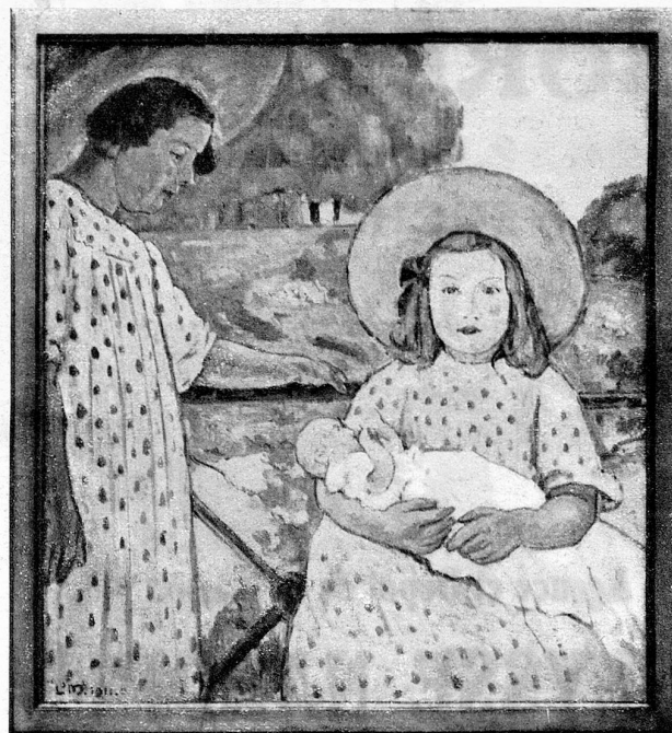
Louis de Meuron. — Fillettes au jardin.

fois les artistes suisses sont chez eux et c'est chez eux qu'ils nous invitent. Le bâtiment démontable et transportable, dont on discutait depuis longtemps les possibilités d'existence, est là, pratique avant tout, sans prétentions architecturales parce qu'il ne saurait actuellement en être question. Tout décor extérieur a été sacrifié à l'organisation intérieure et celle-ci est bien telle qu'on la désirait.