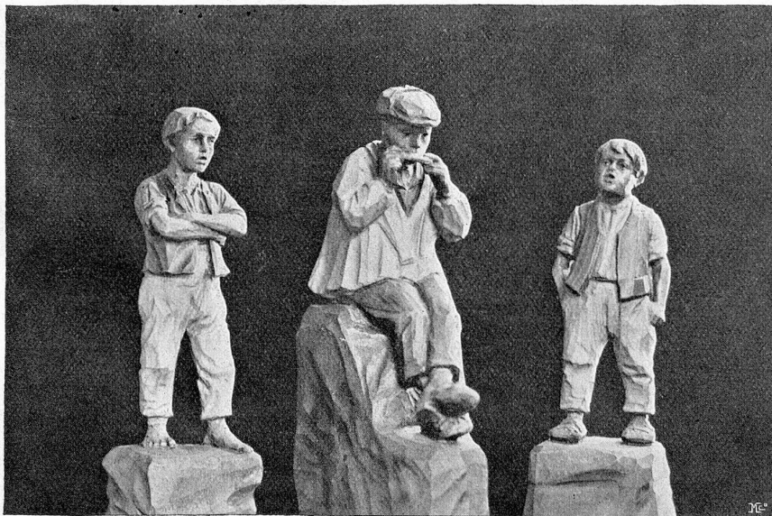
Sculptures sur bois.

Les secours ne seront attribués en règle générale qu'à des artistes