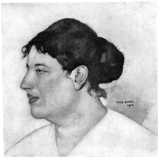
UNTERHALTUNG ..... CAUSERIE ..... BILDNIS MEINER FRAU ..... PORTRAIT DE MA FEMME ..... Schweizer Kunst — N° 153 — Art Suisse