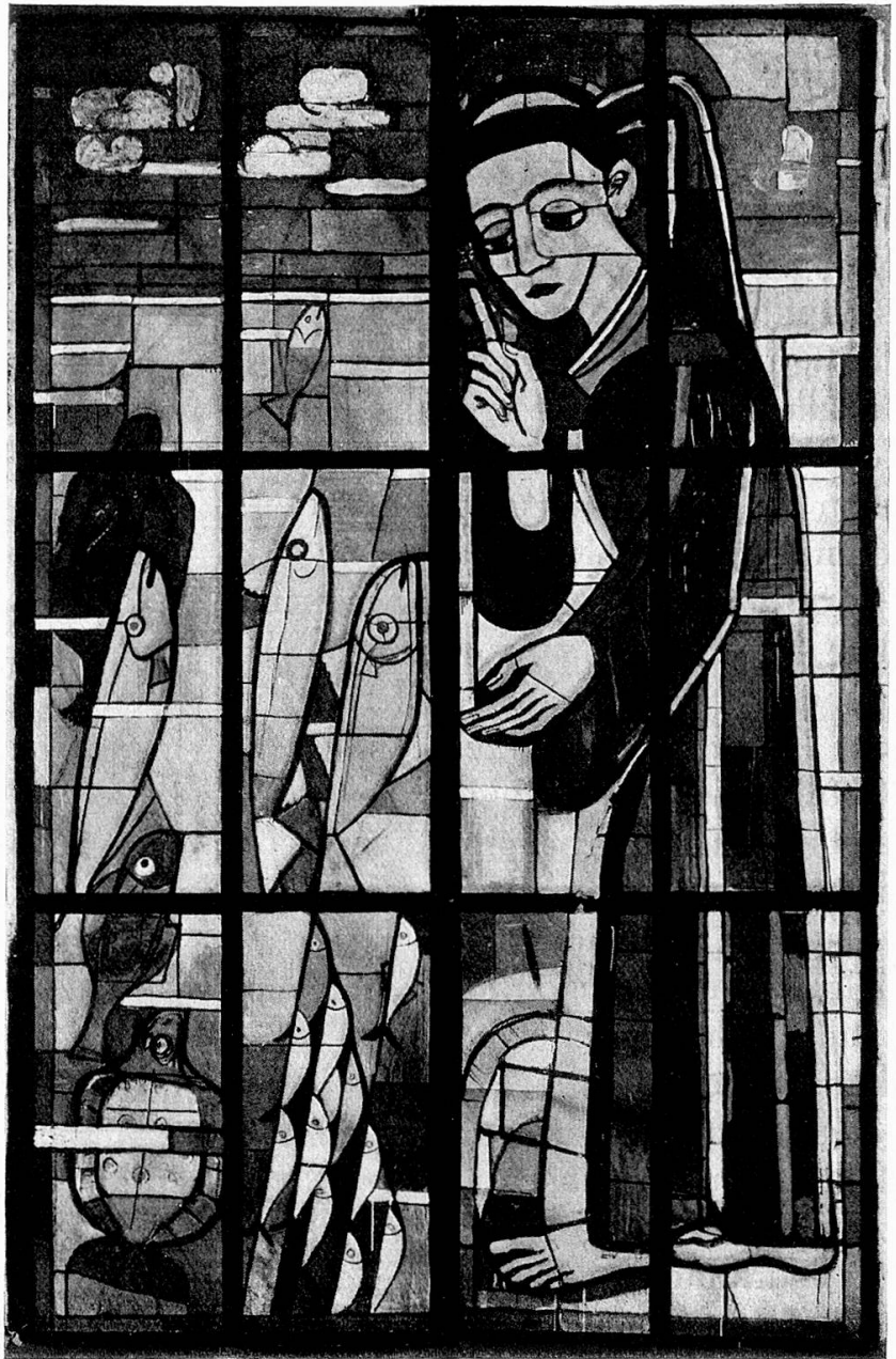
Fischpredigt des hl. Antonius, Entwurf für Glasfenster

Die zweite Urfunktion, die Fuß an Fuß mit dem Schöpfertrieb des Menschen schicksalbestimmend in seinem Leben mitwirkt, die Zuchtwahl und der durch sie bedingte Schönheitstrieb –