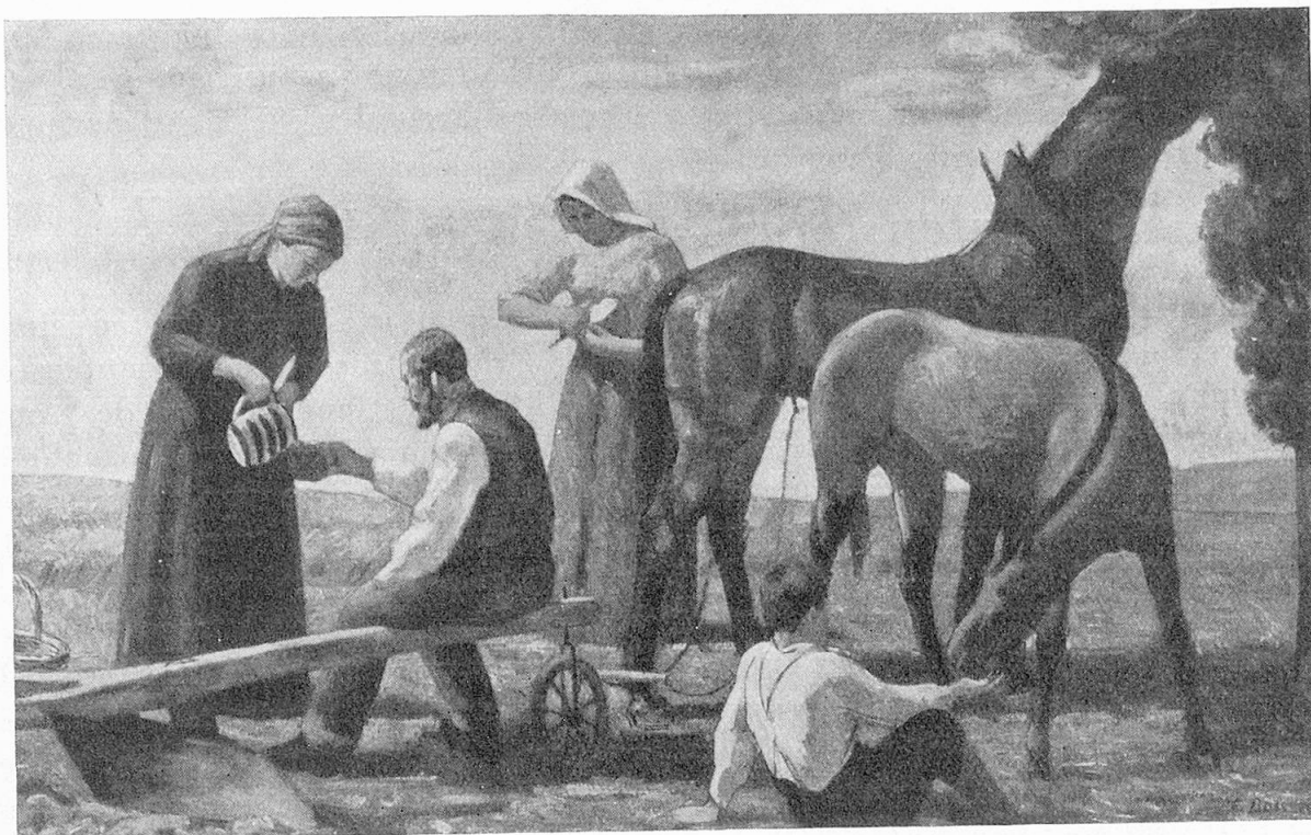
Vesperbrot auf dem Feld. 1929.