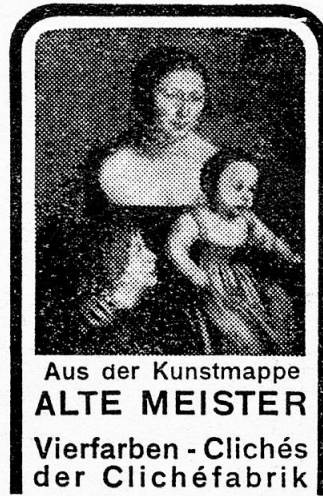
Aus der Kunstmappe ALTE MEISTER Vierfarben - Clichés der Clichéfabrik