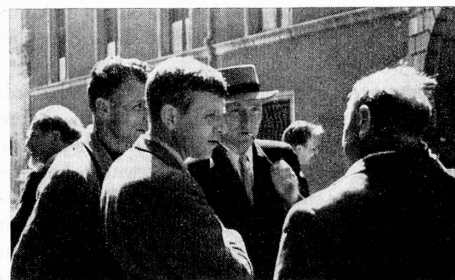
Bilder von der Delegierten- und Generalversammlung 5.-6. Juli 1941 in Solothurn.