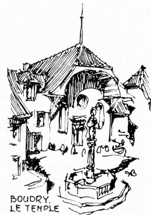
BOUDRY. LE TEMPLE

Il est indispensable que l'architecte se hausse à la dignité de son art et se rende capable de donner un conseil à l'artiste qui parachève