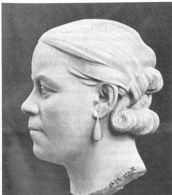
Bildnis meiner Frau. P. Kunz, Bern.