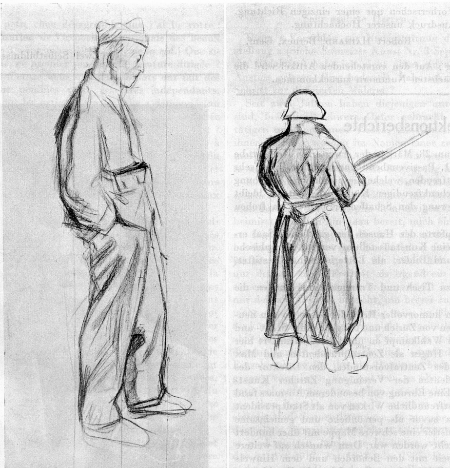
Aus dem Kalender der Schweiz. Zentrale für Verkehrsförderung.