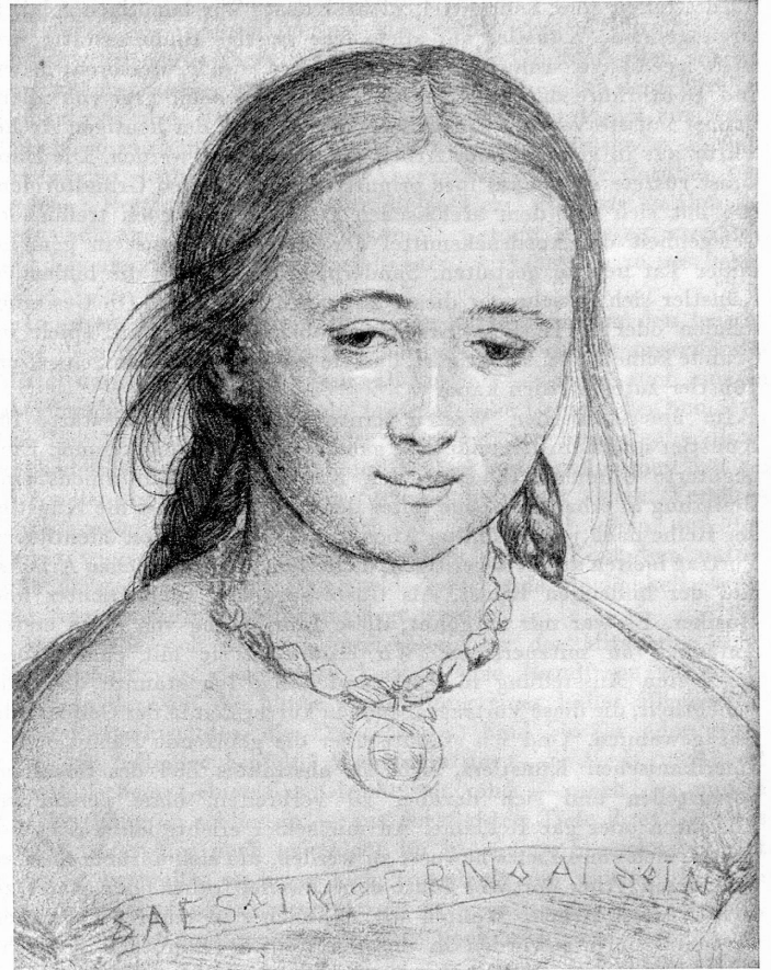
Hans Holbein d. J.

Die Hodlerschüler begingen den Fehler, nach seinen Werken statt in seinem Geist zu arbeiten. Das läuft auf die geistlose Verherrlichung der Popanz und der zügigsten Reklame hinaus, wo schliesslich sogar der Hut auf der Stange gegrüsst werden soll. Gerade diesen Fehler müsste unsere Bildungsstätte mit allen Mitteln bekämpfen. Ohne diesen Fehler wäre die Schweiz wohl damals führend vorangeschritten. Als Lehrmeister weist Hodler uns zu allem Ursprung zurück. Und er