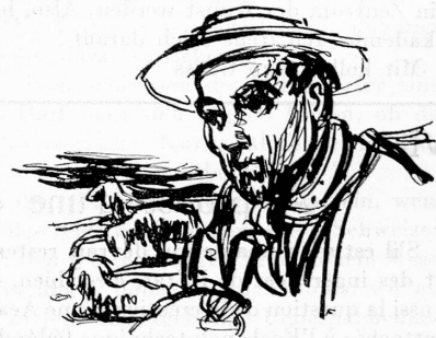
E. Früh, Zürich.

Anders war es bei den Alten. Die Klassiker z. B. dachten bestimmt viel weniger an das Ziel ihrer Tätigkeit, kannten dafür aber den richtigen Ausgangspunkt, um die verwirrende Reichthumsfülle der Erscheinungen, in anschauliche Klarheit zu ordnen. Denn sie hatten von der Technik eine weitaus höhere Meinung als unsere modernen, « inspirierten Sucher », die ja nur finden, was ihnen die böse Stilfee in die Hände spielt. Die Klassiker verliessen sich nicht auf ihr Gefühl, sondern auf ihre Technik ; sie bedurften keiner « Erleuchtung », sondern stiegen der künstlerischen Eingebung mit ihrem Können schnurstraks nach, wenn sie sich nicht bis zu ihnen « her-ablassen » wollte.