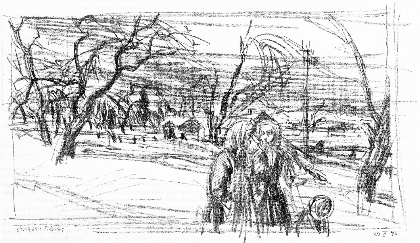
Eugen Fröh, Zürich.

On ne voit pas non plus comment une telle institution parviendrait à contre-balancer l'emprise qu'exerce sur nous l'étranger en matière