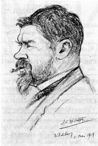
Zeichnung von A. CHRISTOFFEL, Zürich.

Walter METTLER † siehe Schweizerkunst Nr. 10, 1942.