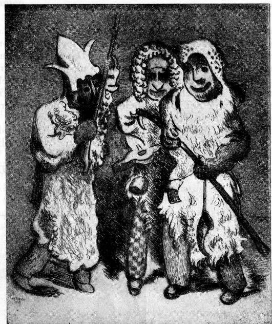
August Weber, Zürich

Die nächste Nummer der «Schweizer Kunst» erscheint im Oktober.