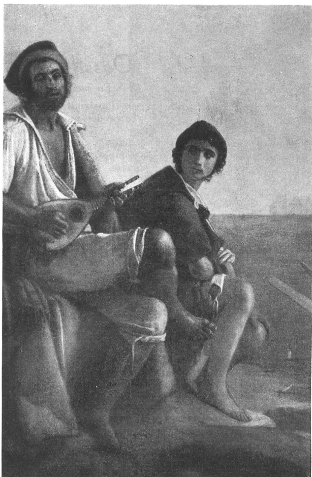
Léopold Robert, partie centrale de «L'Improvisateur napolitain»