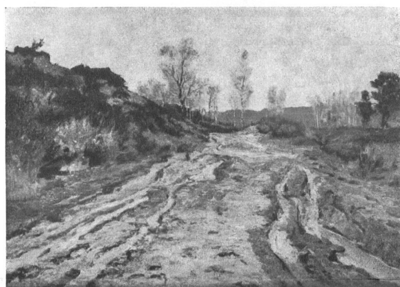
Charles-Édouard DuBois, Chemin de Vaux de Cernay