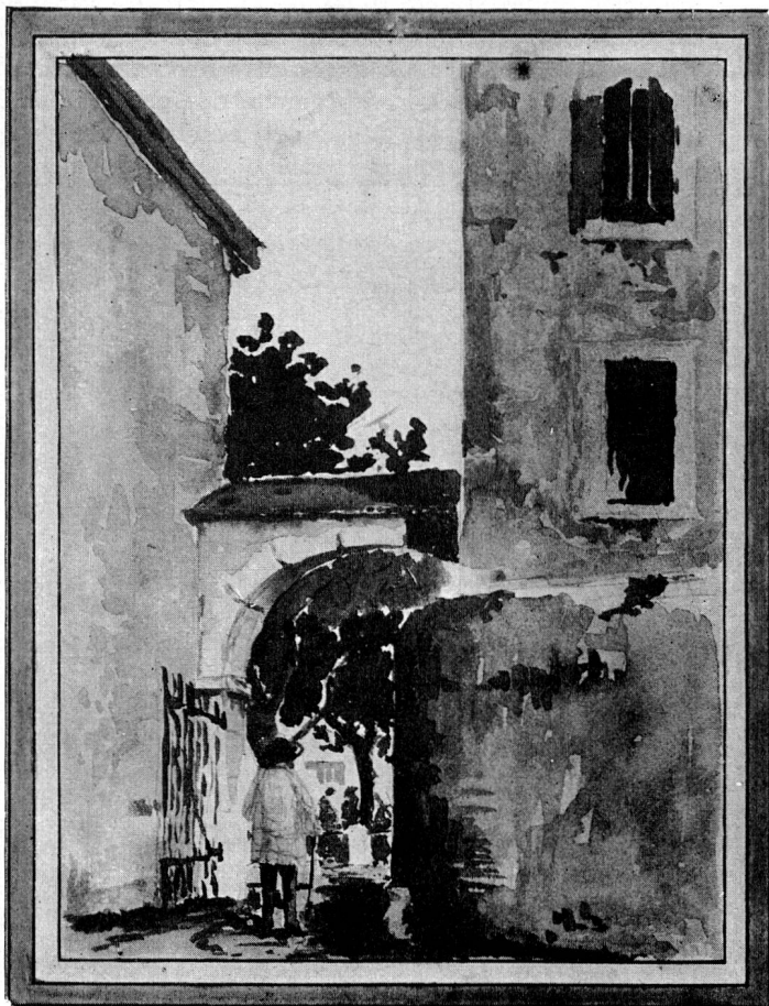
L'entrée de l'Ecu de Savoie sur la Place du Marché Sépia de L. Cottier

Finis Carougeois, profitez-en, Et demain l'on ira disant: Voici Genève, près Carouge.