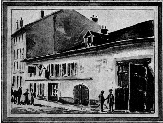
L'ancienne auberge de l'Ecu de Savoie en 1915 Sépia de L. Cottier

René-Louis Piachaud, le poète genevois trop tôt disparu, a laissé le sonnet prophétique que voici: