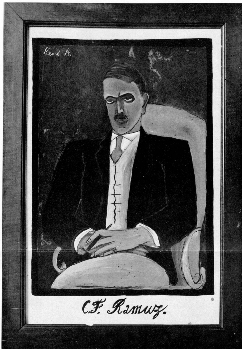
C. F. Ramuz (sous-verre)