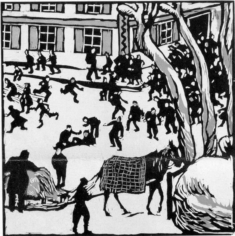
Cuno Amiet 1909