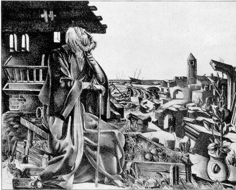
Ernst Georg Rüegg 1919