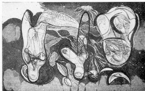
Sergio Brignoni: Incisione