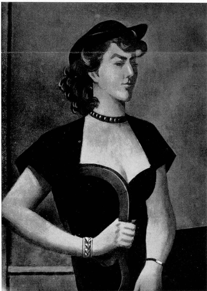
E. Chambon: Portrait de Mlle M. G. 1951