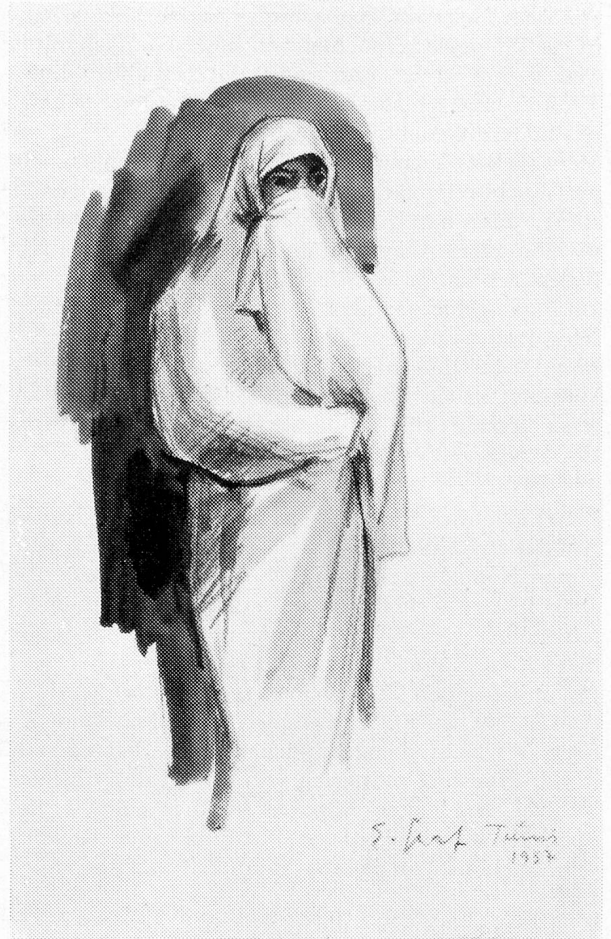
Verschleierte Araberin in Tunis

Im Ort selber war Wochenmarkt. Hunderte von Kamelen, Maultieren und Eseln bringen von weit her die schweren Getreidesäcke auf den bunten Markt. Diese Säcke zeigen mit ihren schönen Streifenornamenten in Naturfarben vom hellen Beige über alle Stufen von Braun bis zum Schwarz die Freude der einfachen Bauern am Ausschmücken der täglichen Gebrauchsgegenstände. Männer in halblangen weiten «Pluderhosen» in allen erdenklichen Farben, mit Turban oder Fez auf dem Kopf, im weiten Burnus aus Wolle oder Kamelhaar versetzten das Malerauge immer aufs neue in Entzücken. Da spielte ein verwaschenes Blau der Hose mit dem eigenartigen Braunoliv eines um die Schultern geschlungenen Tuches, dort setzte der frische rote Punkt eines Fez zum weiten, wallenden Gewand in schwarz-weißen Streifen einen mehr graphischen Akzent. Auf Schritt und Tritt neue