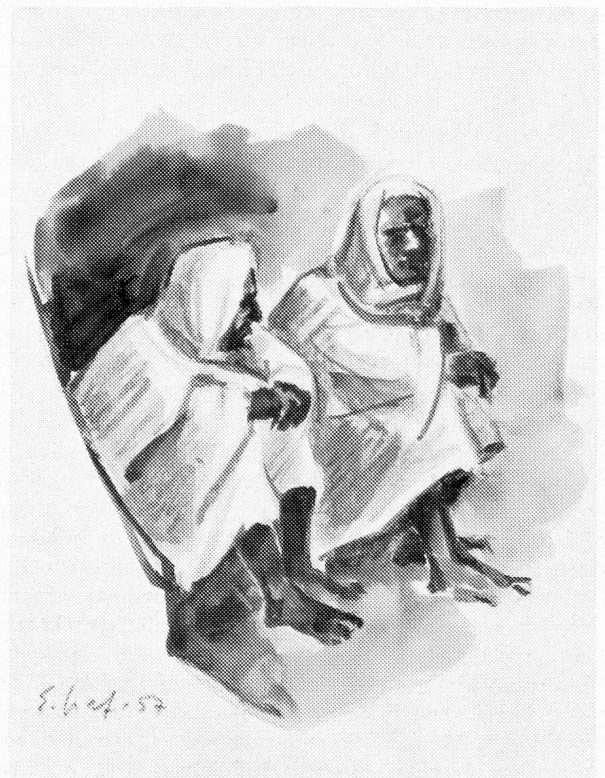
Eingeborene in Médénine

In Kairouan bekamen wir das erstmal das Nationalgericht, den arabischen «Couscous», bestehend aus Grieß, verschiedenen Gemüsen, Rind- und Lammfleisch. Dazu werden verschiedene Saucen serviert. An einer scharfen