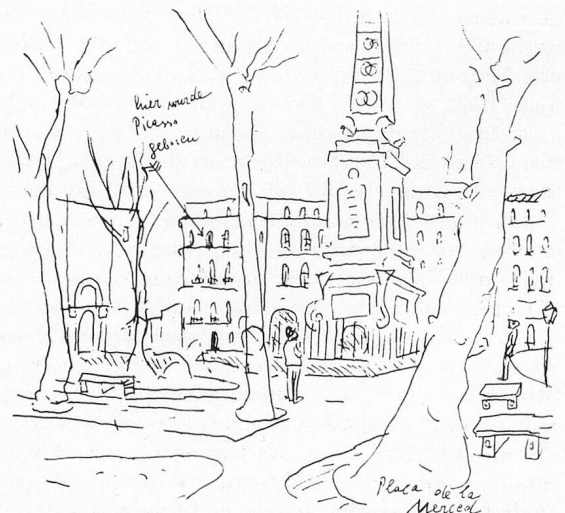
Picassos Geburtshaus

In der folgenden Nacht ging ein sintflutartiger Regen über Malaga nieder, der Eingang zu meinem Hotel wurde überschwemmt, die Loge des Concierges sah wie das Häuschen für eine Bootsvermietung aus. Punkt 11 Uhr erschien Don Juan. Ein Hoteldiener mußte mich zu seinem großen Gaudi auf dem Rücken aus dem Hotel tragen. In strömendem Regen schleusten wir nun durch Malaga. Bald tropfte mir das Wasser sogar von der Brille. Ich wendete ein, daß ich wegen Picasso nicht