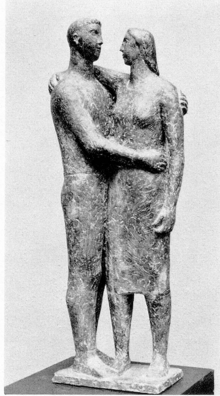
Emil Wiederkehr, Luzern

gleichzeitig diene: der Pflege der Musik und der Pflege der bildenden Künste. Die Stadt Luzern legte anderthalb Millionen dazu und machte damit ein gutes Geschäft, indem sie verfügte, daß der Musentempel gleichzeitig Kongresse beherbergen solle, ferner einen großen Gasthausbetrieb.