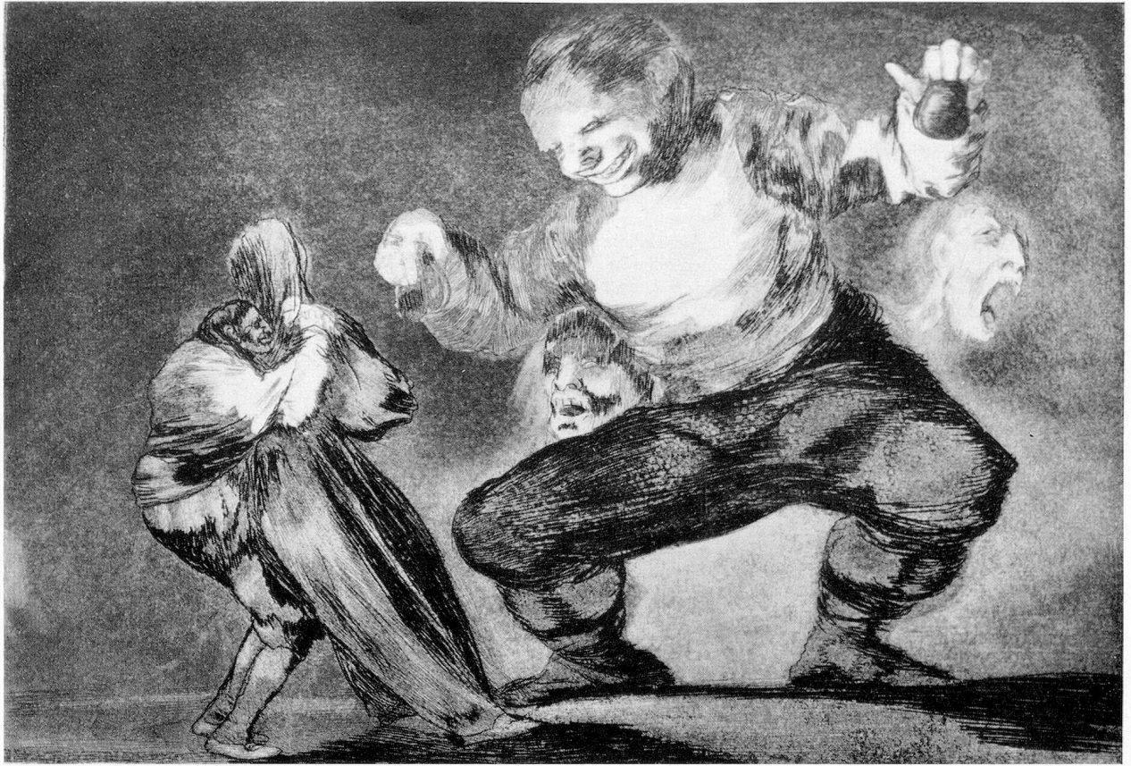
Francisco Goya, «Bobabilicon (le grand niais)», 1864

um neue Schicksale zu haben, andere Saiten klingen zu machen und in neuen Zusammenhängen zu neuem Leben zu erwachen. Dieser unausschöpfbare Zündstoff macht die unvergleichliche Größe des echten Kunstwerkes aus, denn die Kunst hat keinen Boden, und das ist mehr und weit herrlicher als ein goldener.