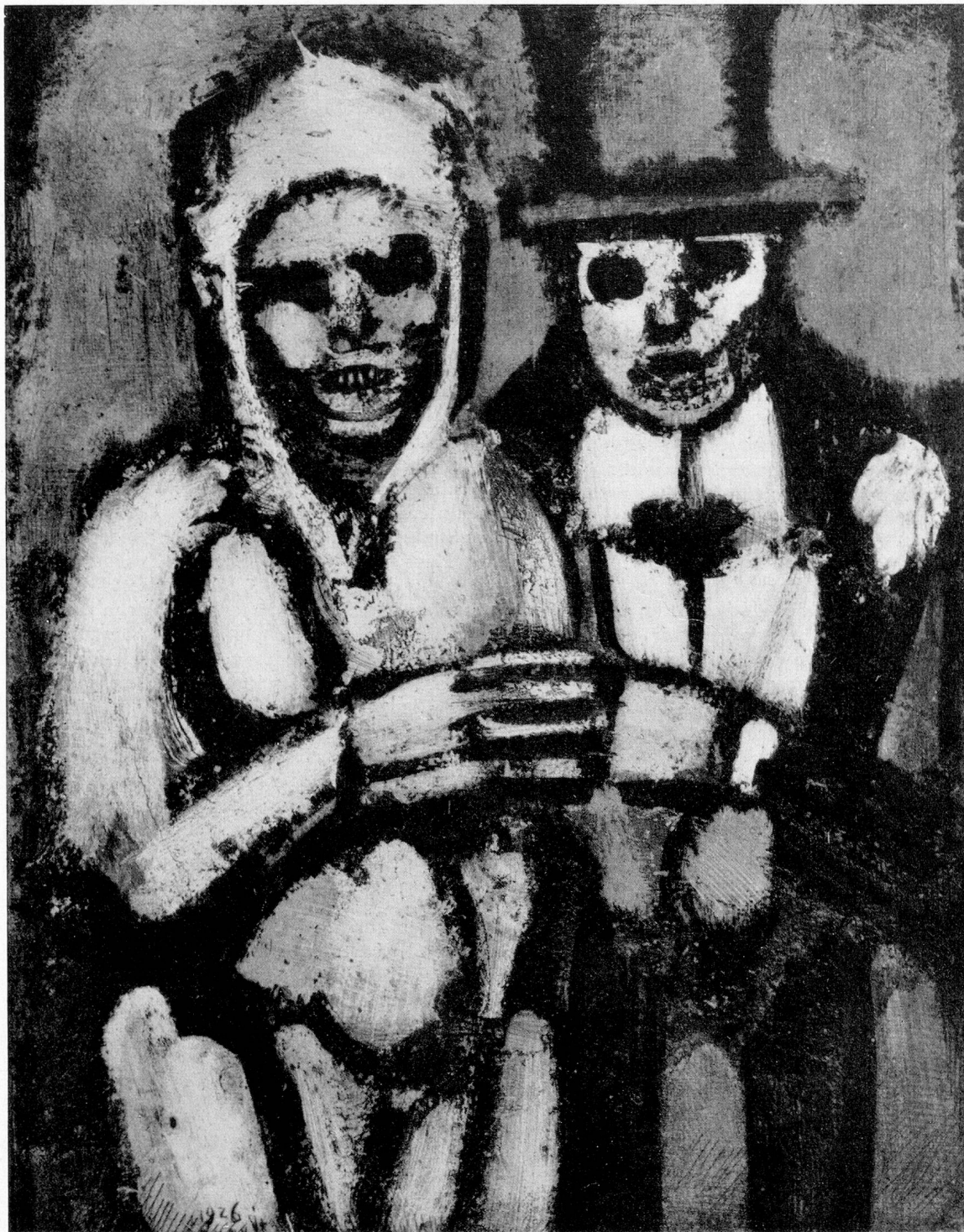
Georges Rouault, Totentanz, 1926

Vallet, Vallotton und – allen voran – von Ferdinand Hodler vermittelten die ersten tief haftenden Eindrücke aus dem Umkreis der zeitgenössischen Malerei. Ich saß dann jeweils mit meiner Mutter noch eine Weile an dem großen, rechteckigen Tisch mit den ehrfurchtgebietenden schweren Eichenstühlen, um die dort aufliegenden Kunstzeitschriften zu durchblättern. Man sprach nur sehr leise, und ich wurde angehalten, darauf zu achten, daß die Seiten beim Umblättern nicht allzu laut sich gebärdeten. Diese kirchenhafte Feierlichkeit, die jedermann in diesen Räumen sich auferlegte, hat dann weiter-