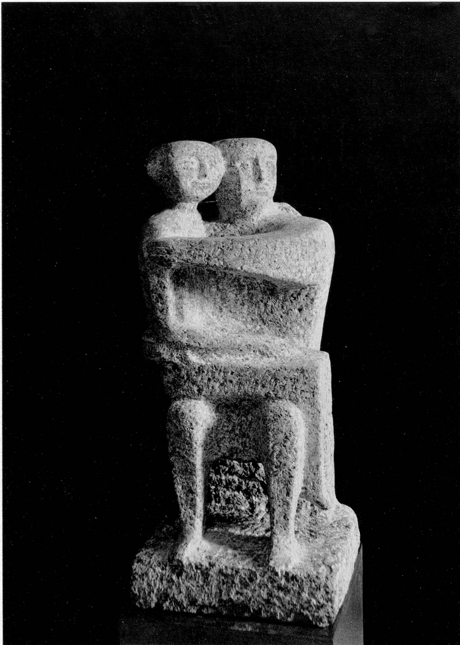
Marcel Perincioli: Mutterschaft N 350