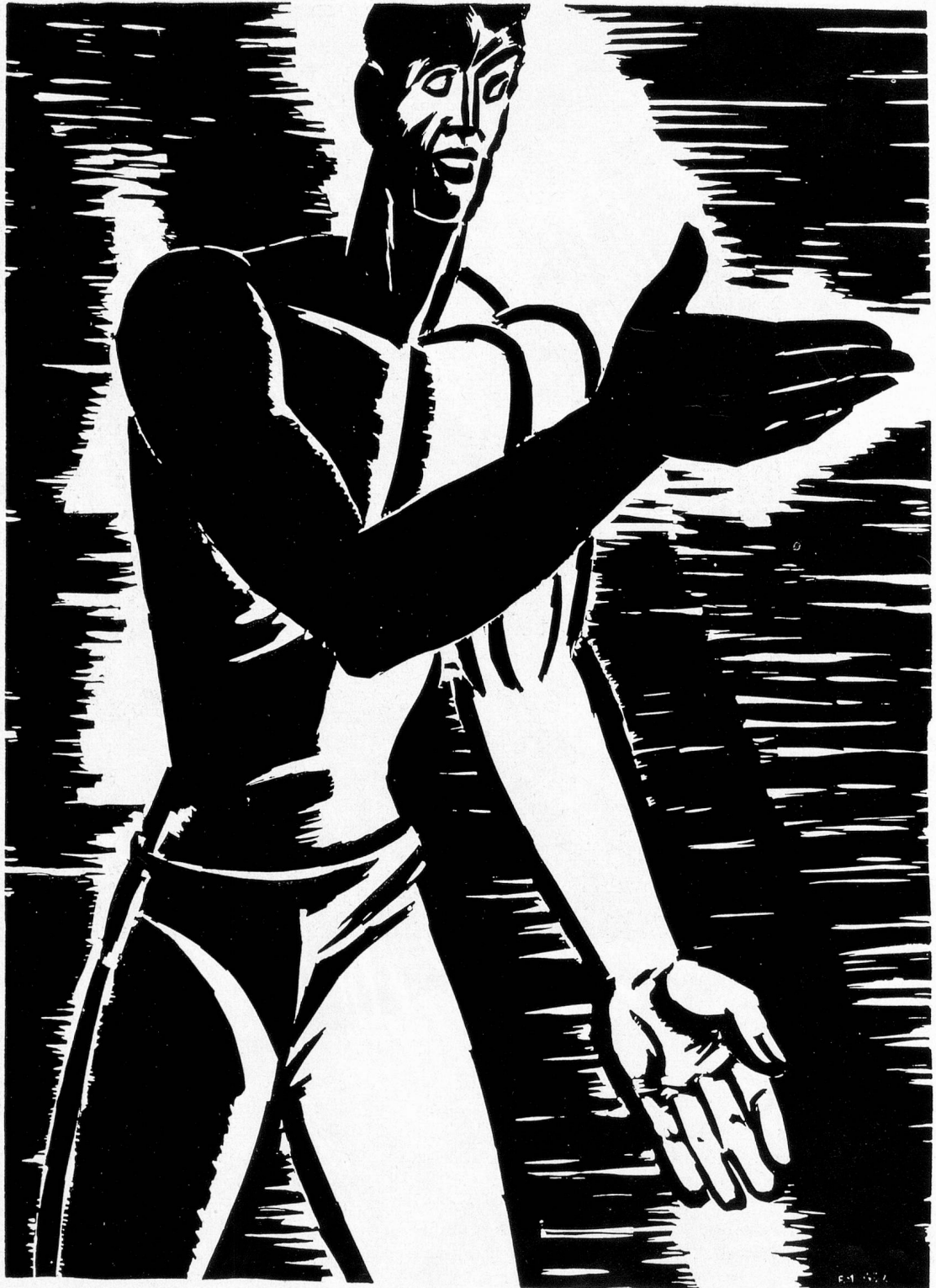
Frans Masereel, Belgien/Frankreich: L'homme qui parle

Die Sprödigkeit des Holzes verlangt den Verzicht auf Details, Konzessionen an einen konventionellen Geschmack widerstreben ihm. Ebenso liegen dem echten Holzschnitler Ästhetentum und Formalismus fern. Mit der Graphik – und am allerdeutlichsten mit dem Holz-