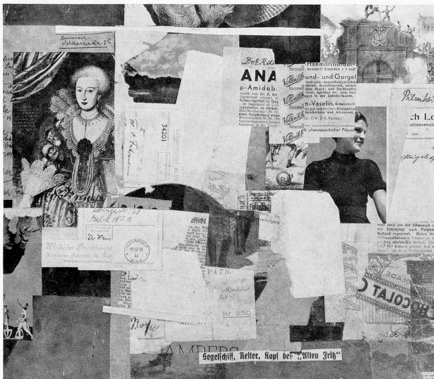
Kurt Schwitters (Auktion Klipstein und Kornfeld, Bern). An der Biennale in Venedig besonders gut vertreten und nach seinem Tode geehrt.

In merito agli altri premi, la Giuria ha deliberato come segue: Premio del Ministero della Pubblica Istruzione, di L. 1 000 000, al pittore Franz Kline; premio «Museo d'Arte Moderna» di San Paolo, di L. 500 000, libero a tutti gli artisti, al pittore Julius Bissier; premio speciale «David E. Bright Foundation», di L. 500 000, per un artista italiano o straniero, a Angel Ferrant;