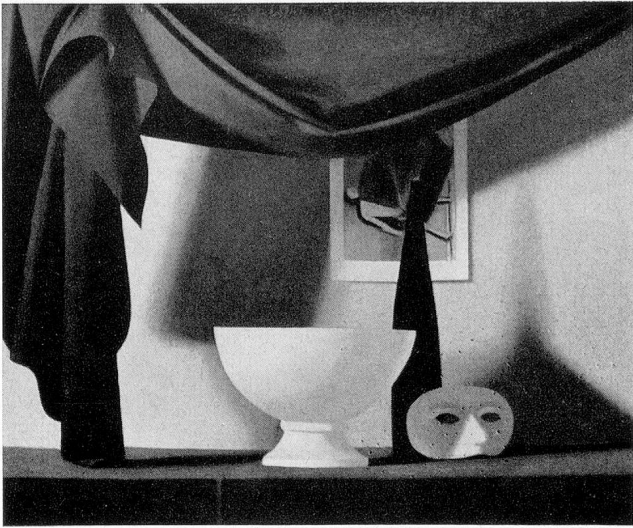
Jean Roll «Nature morte» (Photo J. Arlaud).