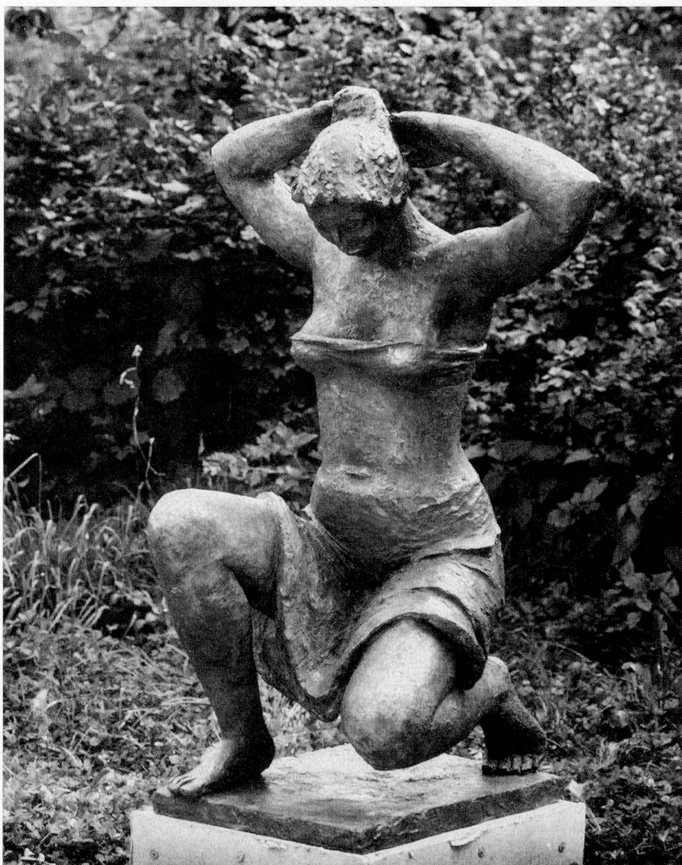
GUSTAVE PIGUET, Bern: Kniende Figur. Höhe 140 cm. Gießerei Brotal, Mendrisio.