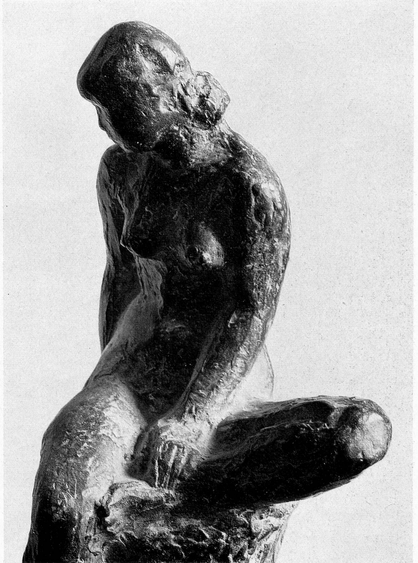
Léon Perrin: «Nue»