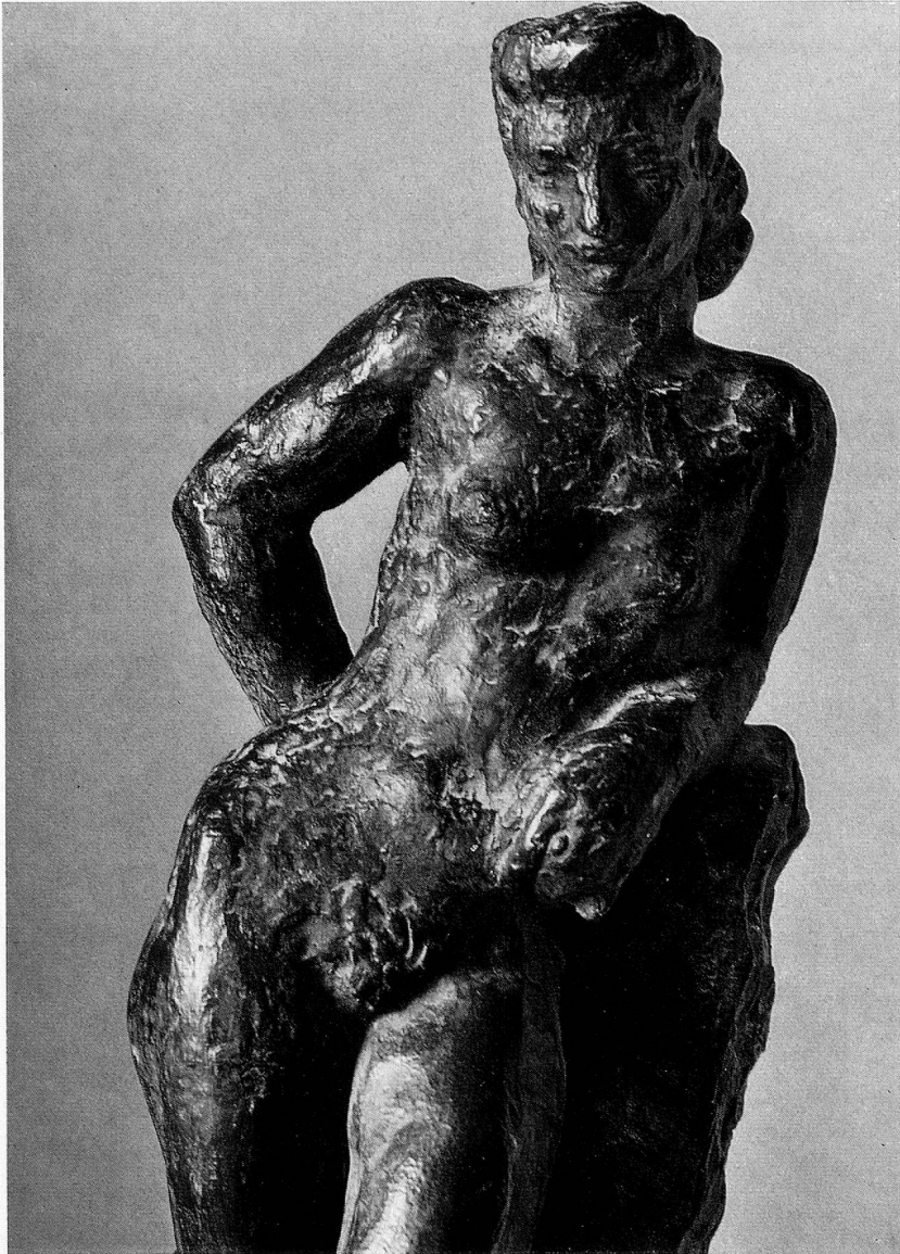
Léon Perrin : «Melpomène». 1930