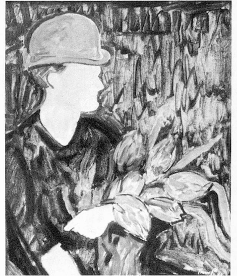
Der rote Hut, 1963

Nachträglich wurde ich noch auf die Bedeutung des Werkes von Turo Pedretti aufmerksam gemacht. Im Klappentext zur Monographie, die Klaus Speich 1966 über den Künstler publiziert hat, schreibt Walter Kern: «In