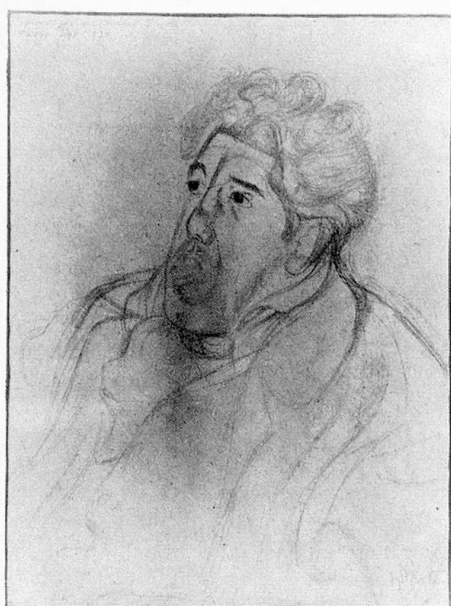
Portrait Michel Simon, 1929