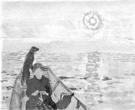
Karl Landolt «Abends im Boot»