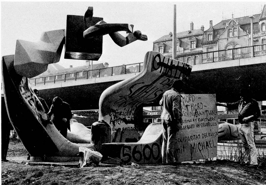
Plastik von Michael Grossert: Nach der Tat

In der Entwicklung des Graphikers gibt sich um 1966 eine Zäsur. 1960–1966 zeigen die Blätter noch häufig malerische und atmosphärische Effekte, die Linien können zum Gekräusel werden, sich zur Punktreihe auflösen oder sich zur differenzierten Fläche verdichten. Auf einigen Blättern – etwa den Punch-Lithographien – ballt sich chaotisches zu explosiver Kraft. Nach 1966 wird der Ausdruck strenger, bestimmter, geordneter. Trotz der augenfälligen Absicht, keine Linie zuviel zu setzen, wachsen die Blätter im Lauf der Arbeit zu immer