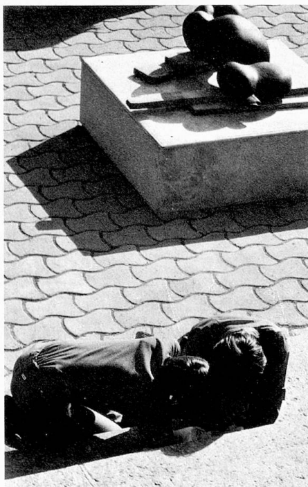
Sculpture à louer – Sektion Waadt

La section de Bâle a choisi d'illustrer les actions des deux demi-cantons, Bâle-Ville et Bâle-Campagne, pour encourager la création d'œuvres d'art destinées à la collectivité. Elle présente des maquettes et des projets proposés à l'occasion de concours et de commandes, par ex. des esquisses réalisées pour l'exécution d'une peinture sur le thème «L'homme et le travail», ou pour l'aménagement d'une cour d'école, etc. ... Par ailleurs, des exemples d'œuvres choisies et exécutées à la suite de concours organisés grâce aux crédits alloués aux beaux-arts par Bâle-Ville ou par Bâle-Campagne se trouvent réunis dans un dossier. On y lit également: «Le crédit «beaux-arts» de Bâle-Ville fut créé en 1918 par la SPSAS de Bâle afin de procurer du travail aux artistes.» Le crédit «beaux-arts» de Bâle-Campagne fut créé dans le même but en 1930.