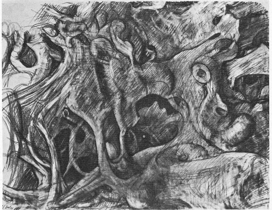
Höhlenlabyrinth, Zeichnung, 1978