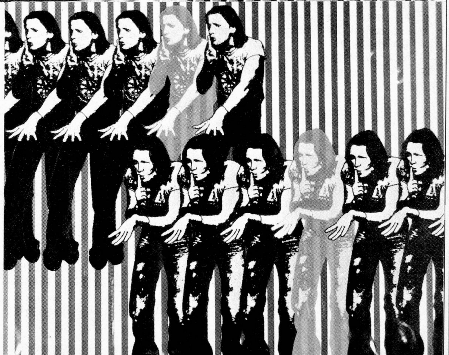
Fotogramme aus dem Experimental Trick-Film «Pssstt...», 1979, basierend auf Zeichnungen