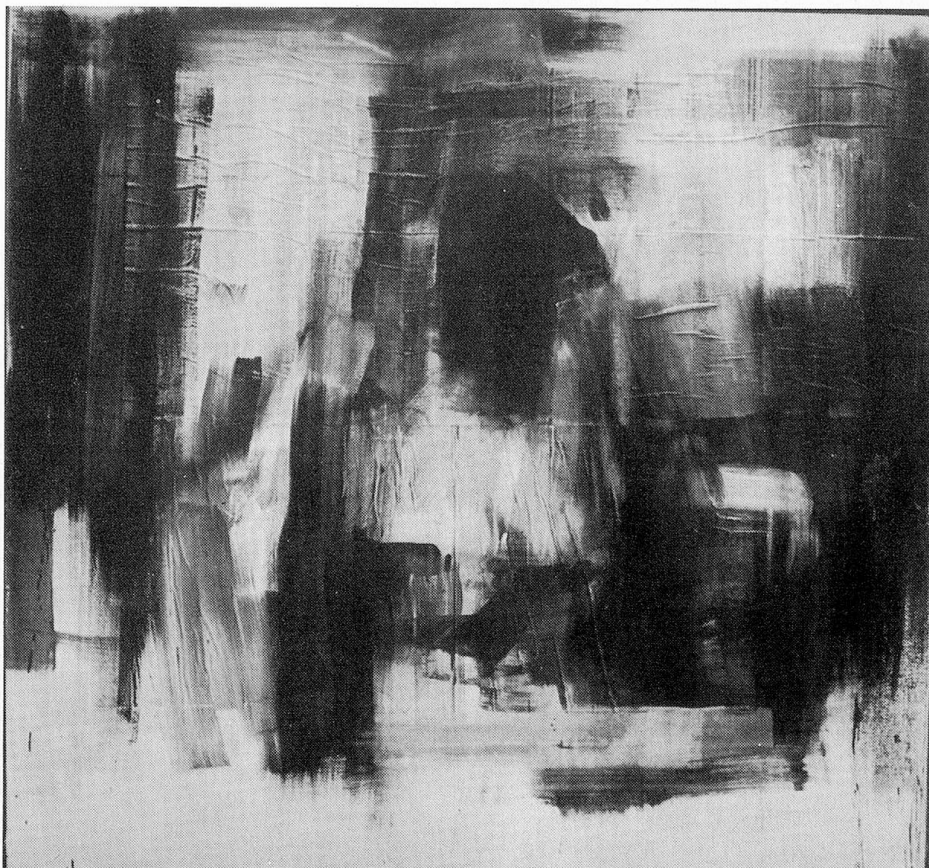
Figura, 1979, Olio su legno

Nato a Locarno il 14. 1. 1954. Frequentato la sezione grafica del CSIA a Lugano. Dedico grande parte della giornata alla pittura. Prima mostra personale a Lugano, 1978. 1980 a Milano e Basilea.