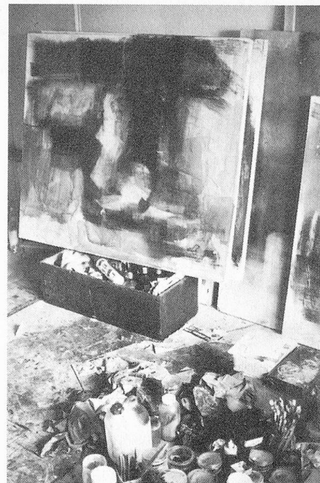
Olio su legno