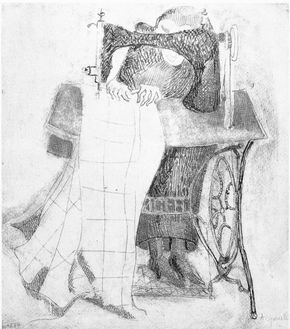
Cucitrice alla macchina, aquaforte, 1977