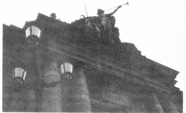
Musée d'Art et d'Histoire de Genève

Der Renaissanceemensch, aufgeweckter Kosmopolit, ist wissbegierig; daher erlebt seine Epoche die Geburt von Kuriositätenkabinetts, von Wunderkammern, die jeder Adlige, jeder Gebildete Europas unterhält. Diese Sammlungen sind nicht eigentliche Kunstgalerien : angeregt vom Bedürfnis nach Wissen, werden sie zu Skulpturensammlungen, zu botanischen und zoologischen Gärten oder zu wissenschaftlichen Laboratorien. Ebenfalls in dieser Zeit beginnen die Grossen dieser Welt, getrieben von Prestigedenken aber auch vom Liebhabertum, Sammlungen von erstaunlichem Reichtum zusammenzutragen. Diese Sammlungen bilden die Grundlage unserer heutigen Museen, wie der Prado der spanischen Könige oder die Uffizien der Medici.