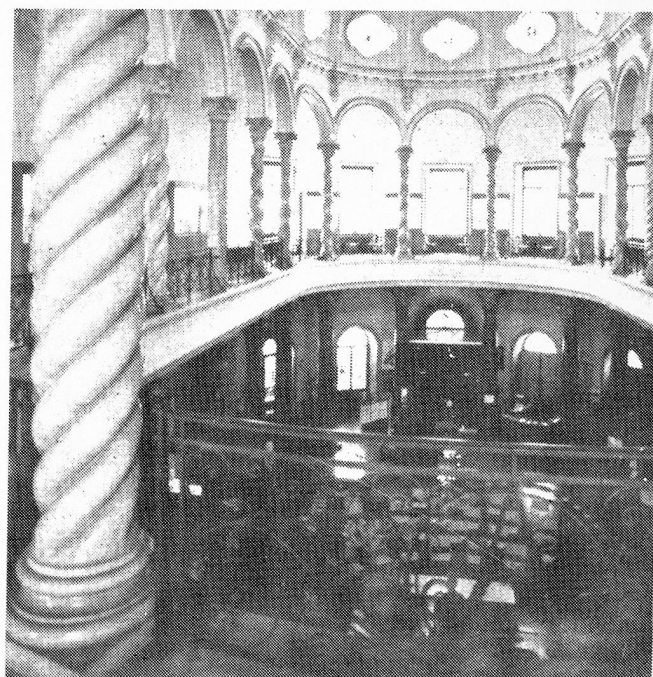
Intérieur du musée de l'Ariana.

A un premier niveau, le musée — et ceci ni les promoteurs de l'initiative, ni les référendaires ne l'ont contesté — contient, expose, montre, donne à voir. A un second niveau — celui où les discussions battent leur plein — le musée peut être soit un lieu dans lequel on présente, soit un lieu qui présente des oeuvres. Dans le premier cas, on a affaire au musée "conservatoire", à ce fameux "mausolée", symbole de l'exposition statique, tandis que dans l'autre, on parle du musée comme "instrument de travail", comme "moyen de communication" ou comme "moteur de sensibilisation". Deux discours, deux optiques, deux idéaux. Et ce débat, actualisé par l'Ariana, est celui d'autres musées en passe de renouveau ou remis en question dans leur activité traditionnelle, comme le musée des Beaux-Arts de la Chaux-de-Fonds, auquel on a reproché sa politique élitaire.