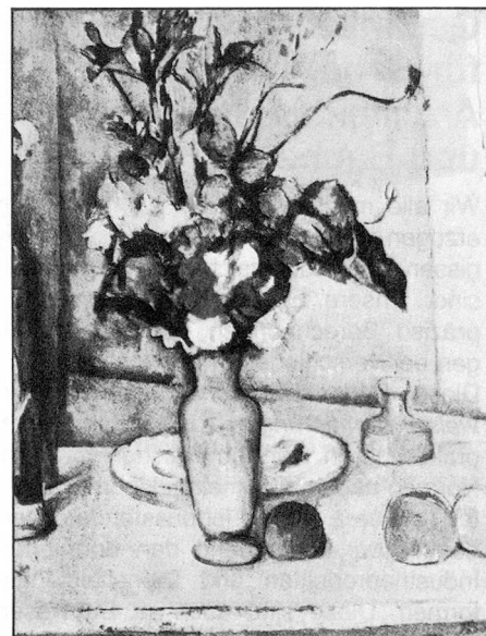
Paul Cézanne, le Vase bleu , vers 1885-1887 (61×50 cm). Paris, Musée du Louvre (Jeu de Paume).