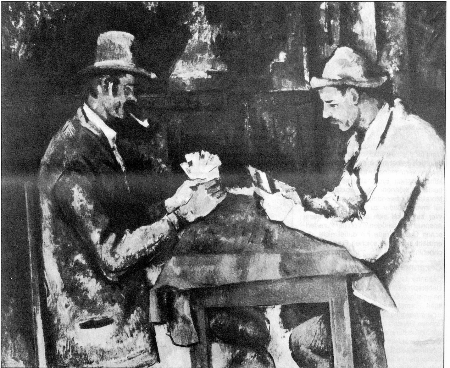
Paul Cézanne, Les Joueurs de cartes , vers 1892. Londres, Courtauld Institute of Art.