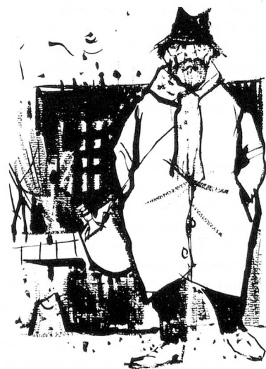
Illustration de l'ouvrage «Du haut de ma potence», Edition du Jura Libre, 1961.