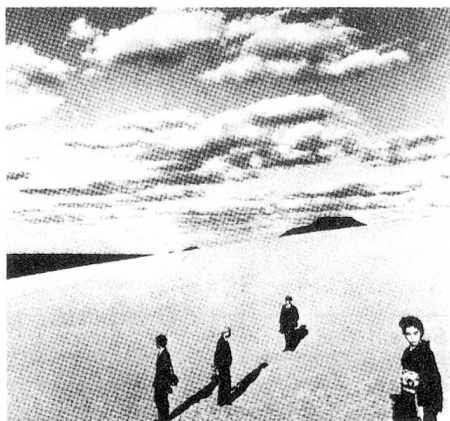
Shoji Ueda, Sand dunes, Jonago 1948-1975, photo noir et blanc, 43 x 35,5 cm.