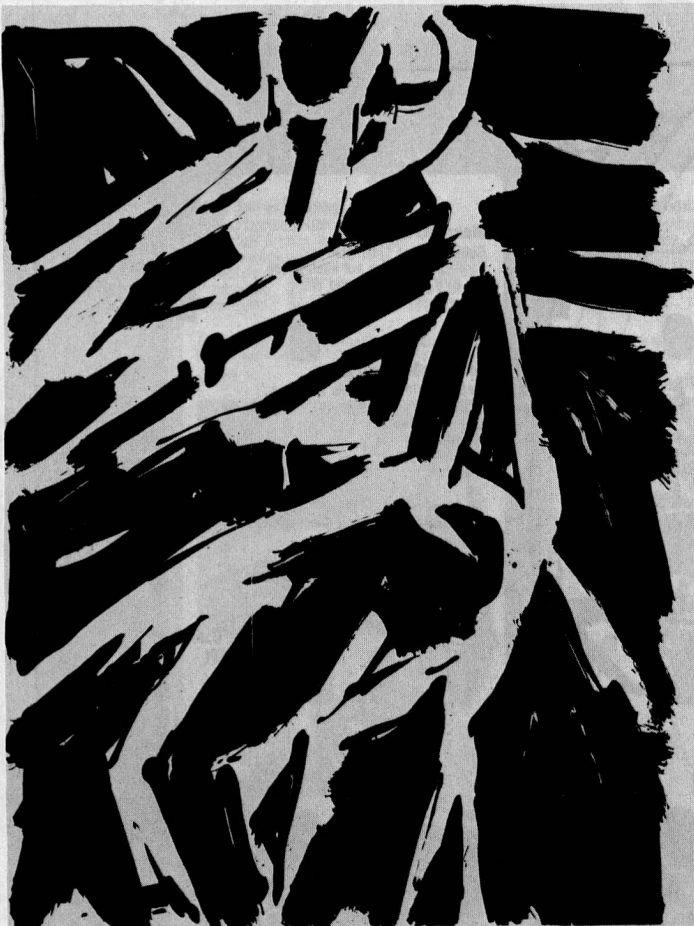
Zinkographie «in Bewegung-live» von Dieter Linxweiler

der Schweiz im Jahr 1974 in einem 1:100000 Maßstab