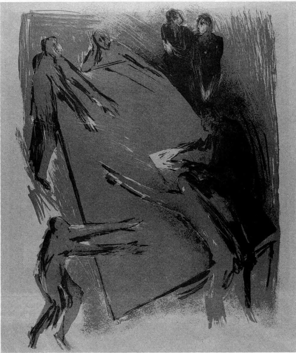
Zinkographie von Beatrice Stuedler

In Zusammenarbeit mit GSMBA Sektion sind 1986 eine Sondernummer (internationale Vierfarb- zung und Originalgrün- Künstler der GSMBA gegeben. Anstelle der üblichen Posterunterschiede im der mer Zus im Fig