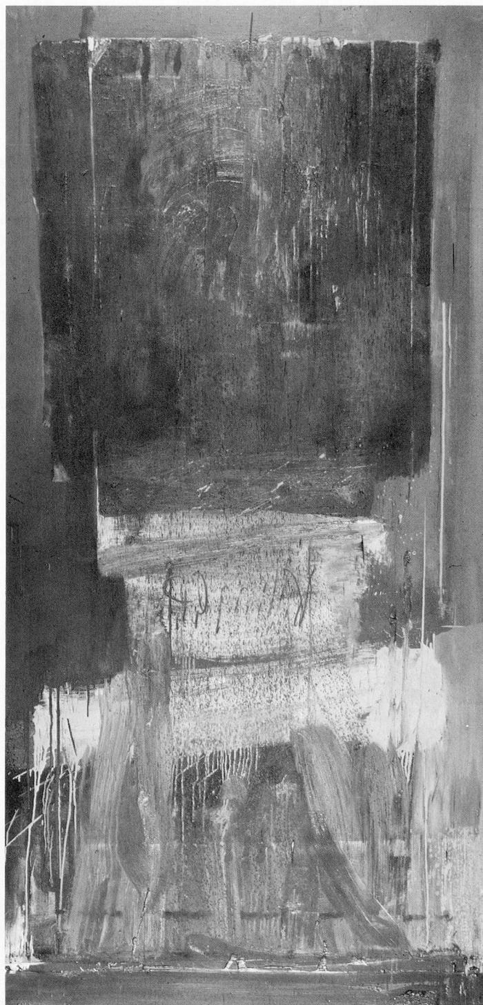
Senza titolo, 1988 olio su tela, 220x110 cm

11. C'est possible. Mais pour les raisons que je viens d'indiquer, je crois que je conseillerais à un jeune de se rendre à l'étranger.