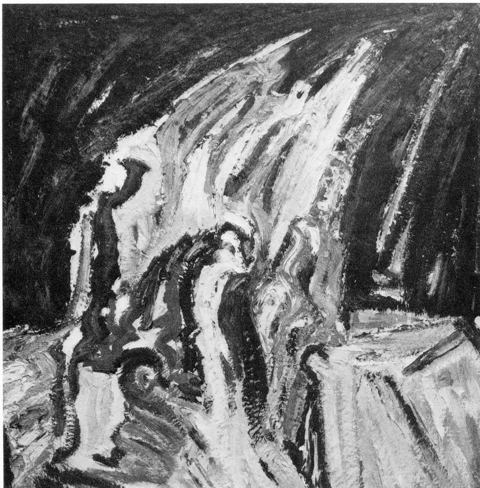
Notturmo, 1961, olio su tela, 80×70 cm

1941 nato a Bellinzona 1961–65 Ha studiato all'Accademia di Brera a Milano Vive e lavora a Lugano, Milano e Düsseldorf