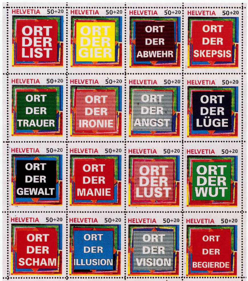
H.R. Fricker: Bearbeiteter Pro-Patria-Markenbogen, Farbfotokopie, perforiert, 1994.